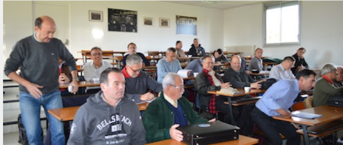
Les 24 instructeurs hydravion du premier stage organisé par Aquitaine Hydravions

Aquitaine-Hydravions a organisé, le week-end des 9, 10 et 11 novembre 2013, le premier stage de formation d'instructeurs hydravions dans les locaux de l'ENAC, à Biscarrosse. Cette première en Europe répondait à la nécessité pour l'aéro-club, agréé ATO (Approved Training Organisation) depuis mai 2013 , de programmer la session annuelle obligatoire de standardisation de ses 9 instructeurs. 14 autres instructeurs, recrutés récemment dans toute la France et même en Belgique et en Suisse ont également participé à ces trois jours de stage. Ils ont pour vocation de former les pilotes de leurs clubs respectifs chez Aquitaine Hydravions, préalable incontournable au développement ultérieur d'hydrosurfaces dans leur propre région.